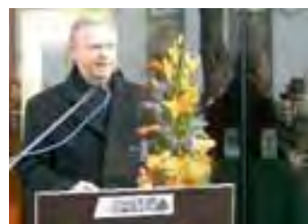
Landrat Jakobek bei der Einweihung der RMV-Mobilitätszentrale am Hauptbahnhof in Darmstadt im Januar 2006.

Mit der Anbindung des Stadtteils Kranichstein an das Straßenbahnnetz konnte im Dezember 2003 ein neues Linienkonzept in Betrieb gehen, das unter anderem mehr Direktlinien zum Hauptbahnhof, mehr Umsteigemöglichkeiten, mehr Pünktlichkeit, mehr Fahrten und mehr Ziele brachte. Es konnten auch wichtige städtische ÖPNV-Bauprojekte realisiert werden und in Betrieb gehen: die Umgestaltung des Bahnhofvorplatzes mit dem zentralen Omnibusbahnhof (ZOB) und der Mobilitätszentrale sowie die neue Haltestelle Schloss. Mit dem Ausbaubeginn der zweigleisigen Straßenbahnverlängerung in Darmstadt-Arheilgen und der Planungsfeststellung für die Streckenführung bis Alsbach Melibokusschule, mit der Vorgabe von schadstoffarmen und kundenfreundlichen Bussen, wurden und werden die Weichen in die Zukunft richtig gestellt.