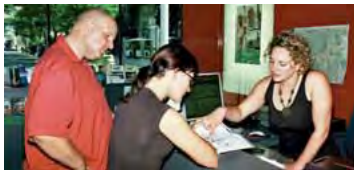
Auskünfte rund um die Mobilität, Fahrkartenverkauf und Touristeninformationen ermöglicht das Team der RMV-Mobilitätszentrale am Darmstädter Hauptbahnhof.

tor) und sind verkehrsgünstig mit den Straßenbahnlinien 2 und 9 sowie den Buslinien N, NE, O und R zu erreichen. Dort können Kunden montags bis freitags von 8.00 bis 12.30 Uhr und montags bis donnerstags von 13.00 bis 15.30 Uhr persönlich und telefonisch Auskunft erhalten, Wünsche und Beschwerden äußern sowie Informationsmaterial anfordern.