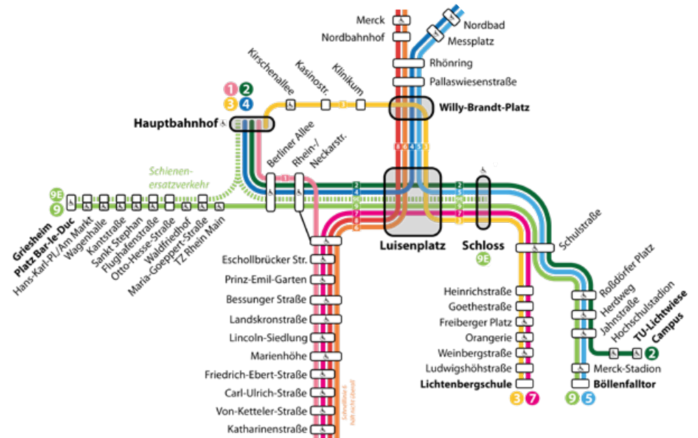
Liniennetzplan 4. September bis 20. Oktober (Ausschnitt)

Bitte beachten Sie für den Zeitraum vom 4. September bis 20. Oktober unseren Schienenersatzverkehr nach Griesheim. Von montags bis freitags zwischen 6 und 21 Uhr fahren Busse mit geänderter Wegführung zwischen „Schloss“ und „Platz Bar-le-Duc“.