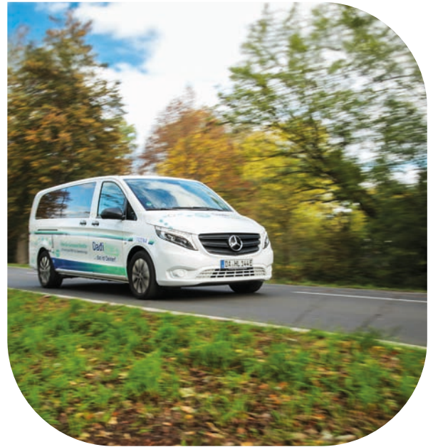
Layout: LindenmayerLehning, Darmstadt